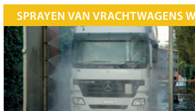
SPRAYEN VAN VRACHTWAGENS WIELBADEN

Virocid® is het ideale product voor de ontsmetting van laarzen of ander schoeisel. Indien voetbaden correct gebruikt worden en op gepaste locaties geplaatst worden op uw bedrijf, dragen deze maatregelen absoluut bij tot een adequate bioveiligheid op uw bedrijf. Concentratie: 0.5 - 1 %.